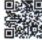
เอกสารที่ เกี่ยวข้อง

ดำเนินการตอบแบบสำรวจความผูกพันฯ ระหว่างวันที่ ๑ – ๓๐ เมษายน ๒๕๖๘ ผ่านระบบออนไลน์ (Google Form) ตาม QR Code และรายงานผล ผู้ตอบแบบสำรวจความผูกพันฯ ภายในวันที่ ๓๐ เมษายน ๒๕๖๘