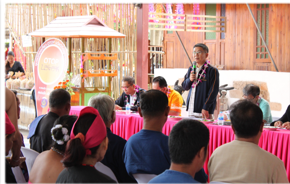
ชุมชนท่องเที่ยว OTOP นวัตวิถีต้นแบบ จังหวัดราชบุรี